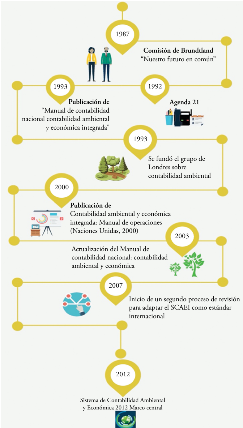
Figura 1. Antecedentes históricos del Marco Central del SCAE