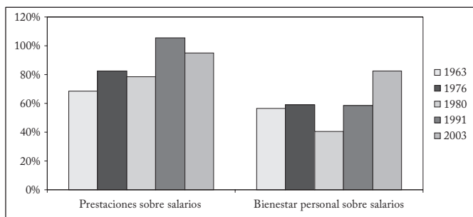
Gráfica 1 Prestaciones sociales y bienestar, 1963-2003 (Porcentaje con respecto a los salarios)

Fuente: informes financieros de Ecopetrol, cálculos del autor.