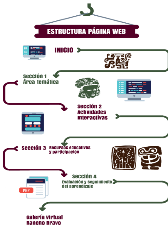
Figura 2. Diseño de la página web