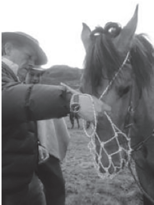
FIGURA 3. Instituciones y reglas. Medida de manejo para que el caballo no se coma la vegetación del páramo. Se propone el uso de bozales.