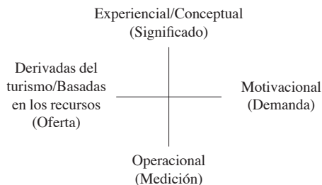
Figura 1. División de las definiciones de turismo cultural

En la bibliografía relacionada con el turismo cultural se pueden encontrar disímiles definiciones que han abordado diferentes enfoques. McKercher & Du Cros (2002) identifican cuatro perspectivas relacionadas con las definiciones de turismo cultural, ellas son derivadas del turismo, motivacionales, experienciales y operacionales. Estos enfoques pueden ser ubicados en los extremos opuestos de dos ejes, como muestra la figura 1. El eje vertical contempla, por un lado, la comprensión de la naturaleza del turismo cultural y su significado en términos conceptuales, y por otro, la identificación y cuantificación del turista cultural. El eje horizontal refleja el turismo cultural desde la perspectiva de la industria o el sistema turístico. Su contraparte representa las definiciones centradas en el turista en sí, motivaciones y razones que lo impulsan a realizar el viaje.