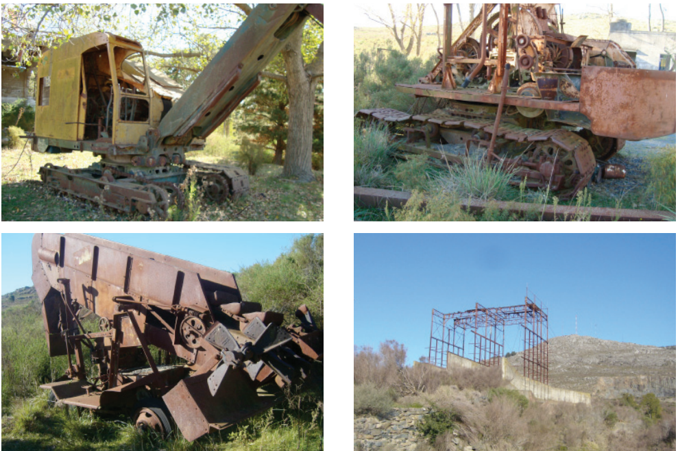
Figura 6. Maquinarias y equipamientos muebles