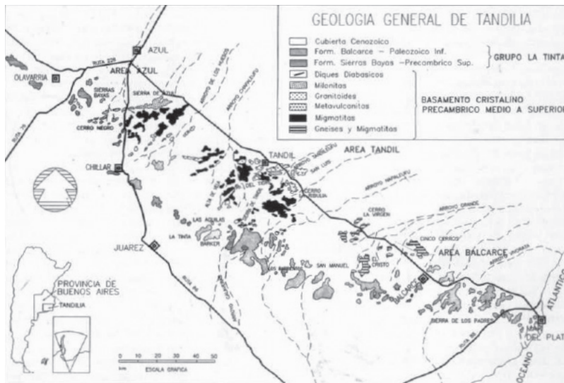
Figura 2. Geología del sistema de Tandilia