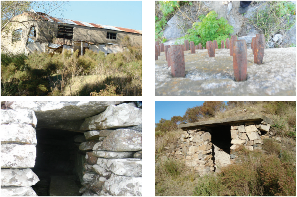
Figura 5. Construcciones e instalaciones mineras inmuebles