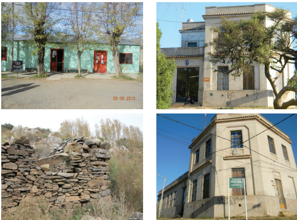
Figura 7. Viviendas o barrios de los mineros

Estratigráficamente, Tandilia consta de un zócalo de basamento cristalino de edad precámbrica y una cubierta sedimentaria de