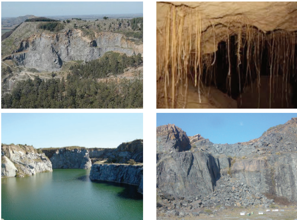
Figura 4. Explotaciones subterráneas y/o a cielo abierto

Como testimonio de la actividad, en numerosas canteras queda maquinaria de diverso tipo (palas, retroexcavadoras, sinfines, etc.) de la que en ocasiones suele ser muy costoso desprenderse o enviarla a algún sitio.