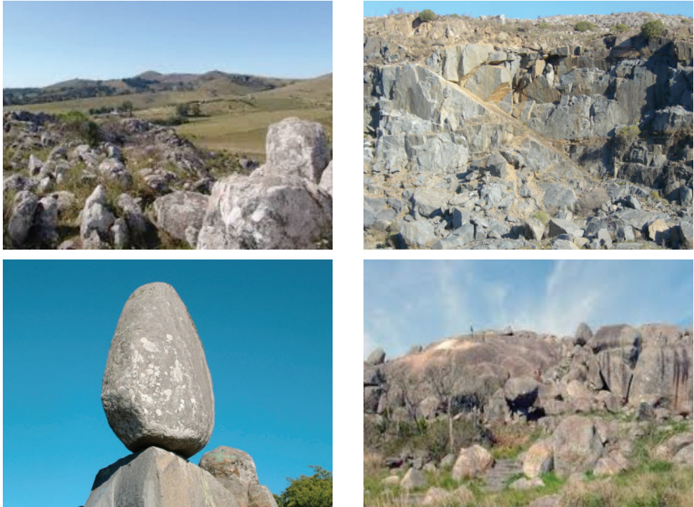
Figura 8. El territorio minero y su geodiversidad