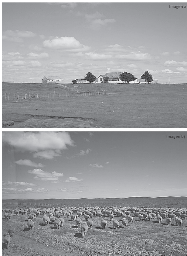
Figura 3. Imágenes a y b) Tierra del Fuego / Land of Fire / Terre de Feu