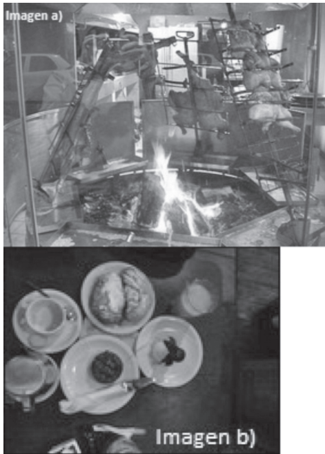
Imagen b) High tea (merienda)