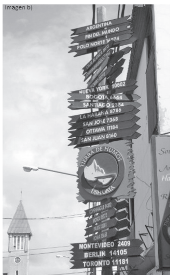
Figura 5. Imagen a) Ushuaia. Imagen b) Sings with distances to various cities (Señales con las distancias a varias ciudades). Imagen c) End of the World (Fin del Mundo). Imagen d) In Ushuaia (En Ushuaia)

Así mismo, la percepción de la lejanía también se expresa en los relatos que cuentan las vicisitudes del viaje a Tierra del Fuego