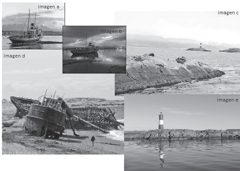
Figura 4. Imágenes a, b, c, d y e (Der wohl suedlichste Leuchtturm... probablemente, el faro más austral)