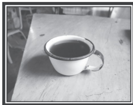
Figura 2. Taza de café de esmalte