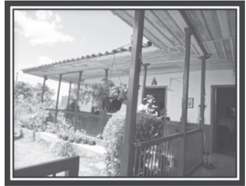
Figura 5. Casa típica en Circasia

En cuanto a las historias locales, es de observar la poca documentación y construcción a nivel local de estas historias relacionadas con sitios de interés patrimonial y el municipio en general. Existen archivos mentales que se pudieron recopilar para luego hacer un trabajo más exhaustivo sobre el pasado.