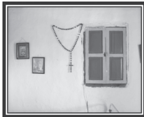
Figura 1. Habitación de una finca

La cultura cafetera, en primer lugar, es una expresión local resultado de un proceso histórico de integración social y adaptación a un territorio. La cultura es un conjunto de ideas, comportamientos, símbolos y prácticas sociales, y como tal es dinámica, se transforma de manera permanente. Sin embargo, muestra unos rasgos que permanecen en el tiempo de acuerdo con la valoración y los significados que los habitantes les asignan y que permiten que subsistan de generación en generación. Lo que permanece en el tiempo se vuelve patrimonio cultural, una herencia de los antepasados. Hoy en día, este patrimonio cultural debe entenderse como construcción social, cuya identificación y revaloración abren la puerta a un mayor entendimiento de los procesos de desarrollo y sus derivados culturales. Elementos culturales como la vivienda cafetera y las costumbres toman fuerza en este concepto que valora lo cotidiano, lo popular (ver figuras 1 y 2).