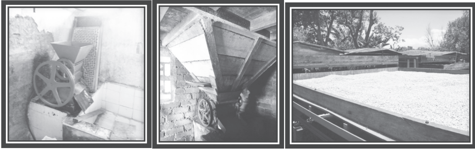
Figura 7. Despulpadora, tolva, elba.