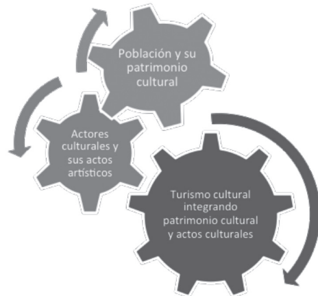
Figura 3. Engranaje del patrimonio, actos culturales y turismo cultural

El turismo cultural es “un proceso social que crea espacios de interacción entre los visitantes, actores culturales y las comunidades receptoras” (Ministerio de Comercio, Industria y Turismo y Ministerio de Cultura, 2007, p. 4). Se construye a partir del patrimonio y sus portadores o de los actos culturales-artísticos y sus creadores, que se integran a la lógica de los productos turísticos. Los elementos constitutivos del turismo patrimonial-cultural-artístico están entrelazados y dependen de la actuación y articulación de sus actores (figura 3), que se mueven en diferentes espacios y lógicas.