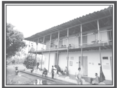
Figura 6. Casa típica en Montenegro