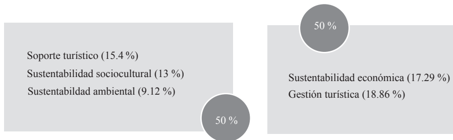
Figura 2. Valores porcentuales de competitividad turística del Área Metropolitana de Bucaramanga

b) Dicho valor porcentual obtenido es relativo, porque depende de la aplicación de un sistema específico de análisis de competitividad turística y porque tiene relevancia si se compara con otras regiones del país que apliquen exactamente el mismo sistema.