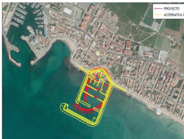
Figura 2. Propuestas de ampliación del puerto “Club Náutico El Molinar”