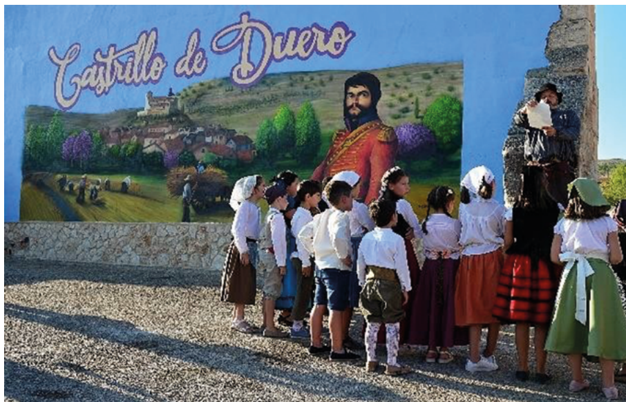
Figura 6. El pregonero escuchado por los niños

dinamización económica de Castrillo del Duero a partir de la recreación histórica de la Boda de El Empecinado .