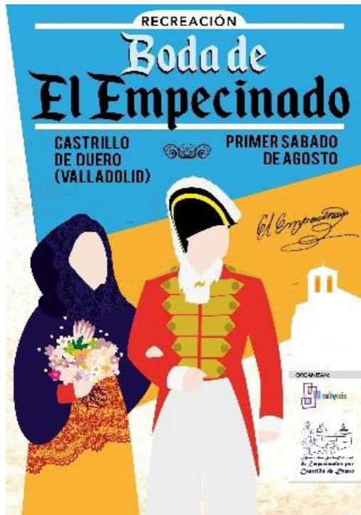
Figura 3. Cartel atemporal de la recreación

Nota. Encontrado en el proceso de investigación.