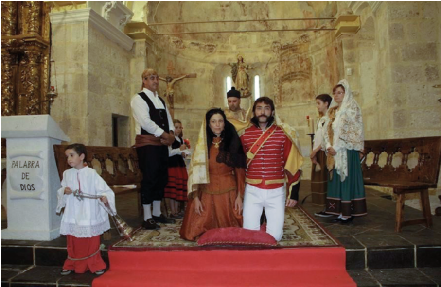
Figura 5. Los novios en el interior de la iglesia

Nota. Fotografía tomada por Agapito Ojosnegros (2017).