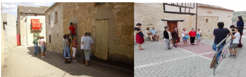
Figuras 1 y 2. Fotografías alusivas a la recreación

Nota. Fotografía 1: grupo de personas decorando las calles para la recreación. Fotografía 2: ensayo general el día de la recreación. Fotógrafa: María Ángeles Acebes (2014 y 2018).