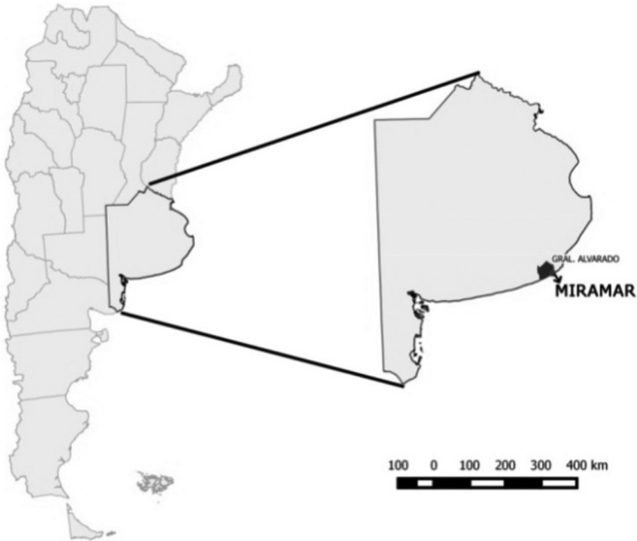
Figura 1. Localización de Miramar

infraestructura de servicios básicos y energías alternativas; el sistema de tratamiento de efluentes y espacios públicos y recreativos; diferentes iniciativas para la recuperación de residuos sólidos urbanos; la implementación de un plan de forestación; la puesta en marcha de programas de promoción de empleo para jóvenes y pequeños emprendedores; la promoción y realización de campañas de sensibilización ambiental para prestadores de servicios turísticos, entre otros.